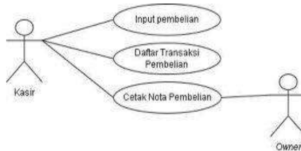
Gambar 5. Use Case Diagram Pembelian

Pada gambar use case diagram laporan mengenai laporan neraca, arus kas, dan laba rugi, penjualan, pembelian, kas keluar Jeviya Beauty Bar.