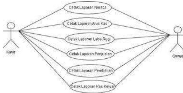
Gambar 4. Use Case Diagram Laporan

Pada gambar use case diagram laporan mengenai laporan neraca, arus kas, dan laba rugi, penjualan, pembelian, kas keluar Jeviya Beauty Bar.