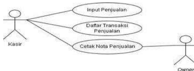
Gambar 6. Use Case Diagram Penjualan

Pada gambar use case diagram pembelian terdiri dari input pembelian, daftar transaksi pembelian, cetak nota pembelian Jeviya Beauty Bar.